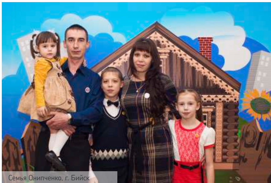
Семья Олимпченко, г. Бийск