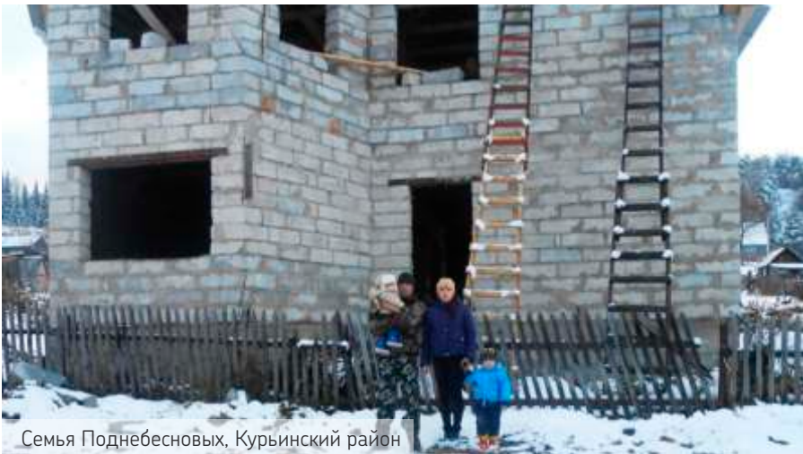
Семья Поднебесных, Курьинский район