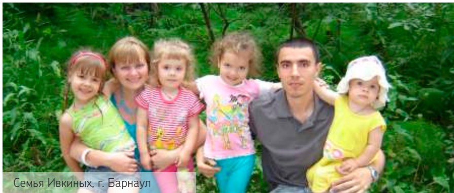
Семья Ивкиных, г. Барнаул