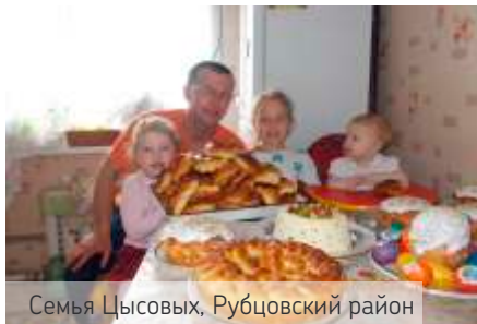
Семья Цысовых, Рубцовский район